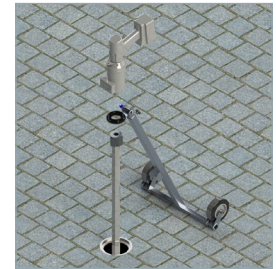
Exemple d'utilisation sur une vanne enterrée